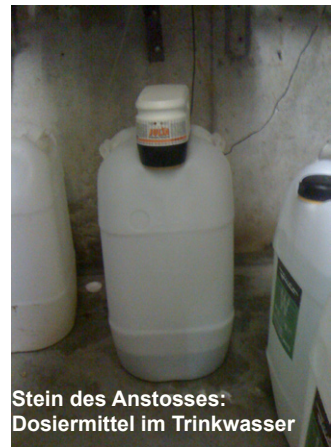
Stein des Anstosses: Dosiermittel im Trinkwasser

All diese „Ungeheuerlichkeiten“ hat nun die Sprecherin der Mieterinitiative im Dezember auch dem Vaihinger Bezirksbeirat vorgebracht. Dieser verlangte daraufhin auf Antrag der Fraktion SÖS/Linke/Plus in einem einmütig gefassten Beschluss, dass die SWSG und das Gesundheitsamt auf der nächsten Sitzung des Gremiums zu den Anschuldigungen stel-