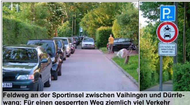
Feldweg an der Sportinsel zwischen Vaihingen und Dürrlewang: Für einen gesperrten Weg ziemlich viel Verkehr

Von seinen Leser/innen immer wieder auf den fortbestehenden Mißstand hingewiesen, wandte sich VorOrt im Frühsommer an die zuständigen städtischen Ämter. Bei einem Lokalalter-