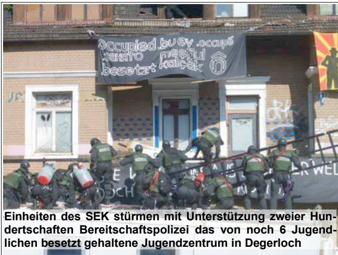
Einheiten des SEK stürmen mit Unterstützung zweier Hundertschaften Bereitschaftspolizei das von noch 6 Jugendlichen besetzt gehaltene Jugendzentrum in Degerloch

Bahn und fuhren zum Hauptbahnhof. Die Passanten und Fahrgäste wurden per Flugblatt und Durchsagen über unser Anliegen informiert. Der Großteil der Menschen reagierte voller Verständnis auf unsere Aktion. Nachdem wir ein wenig am Bahnhof in der U-Bahnstation unseren Unmut kund getan haben, zogen wir weiter, um Richtung Berliner-Platz zu fahren. Dort trafen wir das erste mal auf